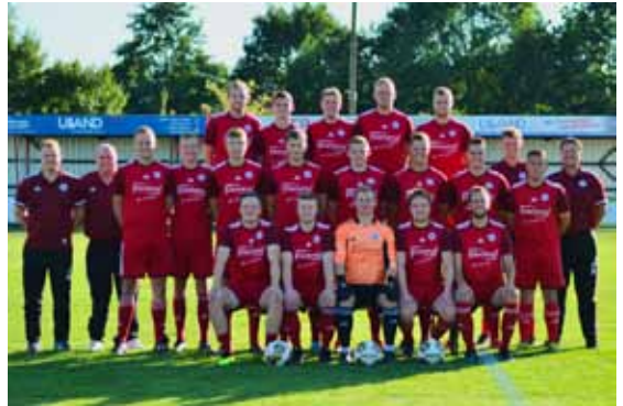
Der VfB Alstätte in der Saison 2022/23

Der VfB Alstätte ist mit einem 3:1 gegen Gahlen, einem 4:0 in Heek und einem 1:0 in Flaesheim ins neue Jahr gestartet; Ergebnisse, die einiges Aussagen. Und die zeigen, dass sich der VfB auf Kurs befindet – derzeit eben über dem Strich.